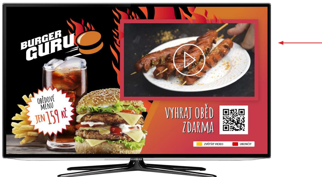
Obrázek 7 Využití videa v HbbTV reklamní aplikaci.