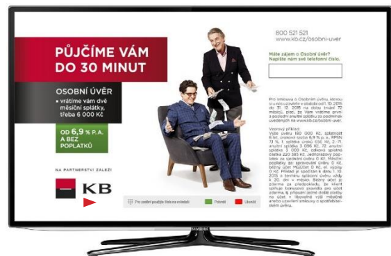
Obrázek 4 Příklad navigační lišty.