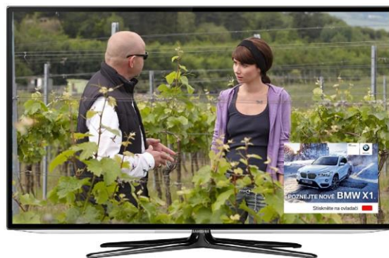
Obrázek 9 Ikona červeného tlačítka (300 × 300 px)