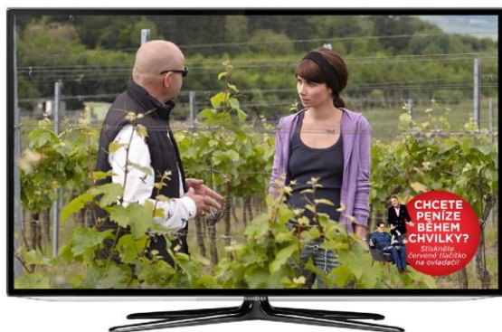
Obrázek 8 Ikona červeného tlačítka (300 × 300 px)

Podoba ikony červeného tlačítka ovlivňuje to, jestli uživatel aplikaci spustí nebo ne. Měla by být natolik zajímavá, aby uživatele motivovala ke spuštění aplikace. Při návrhu ikony červeného tlačítka je dobré si uvědomit, že dopředu nikdy nevíme, na jakém barevném podkladu (pozadí) se bude ikona zobrazovat.