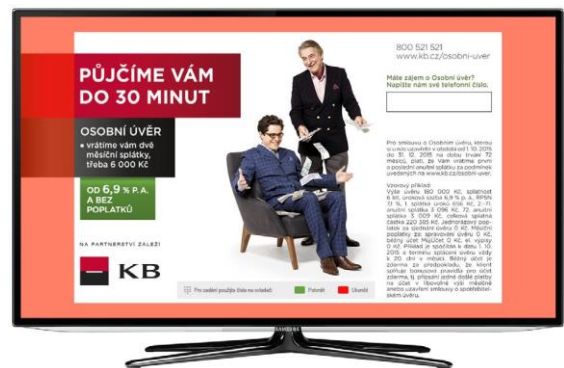
Obrázek 1 Zobrazení celé aplikace (1280 × 720 px).