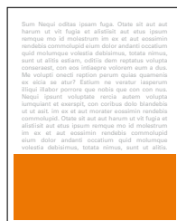
1/3 strany na šířku 205x90 mm čistý formát 175x80 mm na zrcadlo