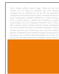
1/2 strany na šířku 205x136 mm čistý formát 175x120 mm na zrcadlo