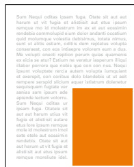
1/4 strany na výšku 100x136 mm čistý formát 85x120 mm na zrcadlo