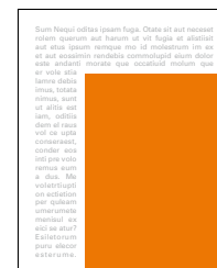
JUNIOR PAGE 131x176 mm čistý formát 117x161 mm na zrcadlo