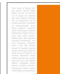
1/2 strany na výšku 100x275 mm čistý formát 85x248 mm na zrcadlo