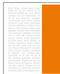
1/3 strany na výšku 71x275 mm čistý formát 55x248 mm na zrcadlo